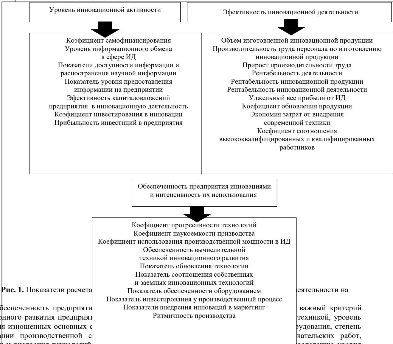
Рис. 1. Показатели расчета

Эффективность инновационной деятельности предусматривает определение способности предприятия к производству инновационной продукции и характеризуется анализом темпов производства новой продукции, определением целесообразности производства той или другой продукции, необходимостью направления средств в инновационное развитие, эффективности работы маркетинга по сбыту определенного типа и вида продукции, размеров дохода от результатов инновационной деятельности (ИД) и выручки от реализации инновационного типа продукции, суммы расходов на проведение ИД. За приведенной группой существуют возможности относительно оценки уровня поддержки государством инновационной деятельности предприятий и основные показатели приведены на рис. 1.